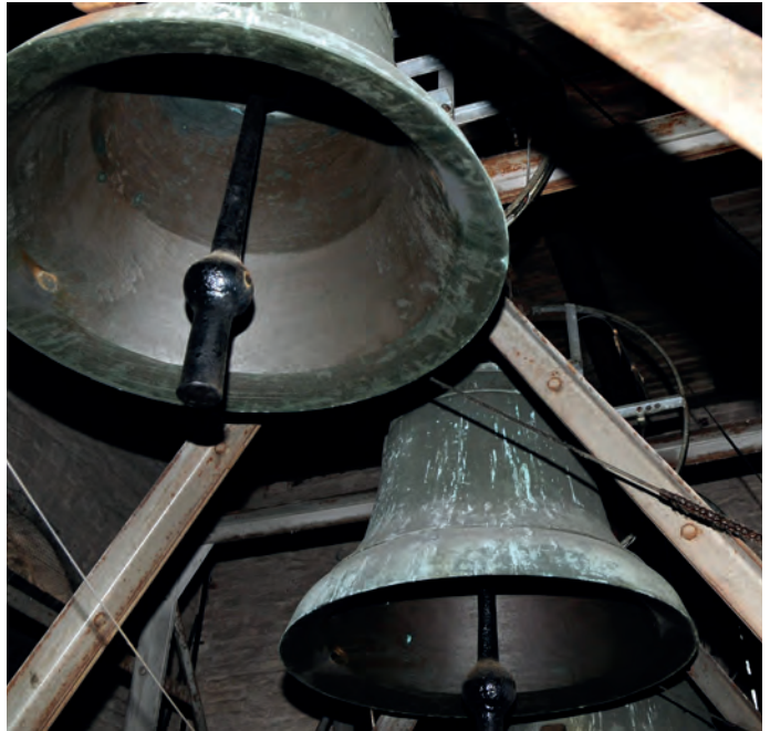
Die Glocken der Christuskirche

In Israel, also dort, wo Jesus lebte, war und ist das anders: Der neue Tag beginnt um sechs Uhr abends mit den Stunden der Nacht – und ab sechs Uhr in der Früh beginnen die Stunden