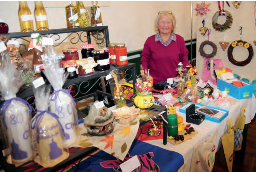
Der Bastelkreis beim Kirchenjubiläum

Unser Basar wird in der Adventszeit wie immer im Vorraum der Kirche zu finden sein, immer vor und nach dem Gottesdienst und zu besonderen Anlässen, wie Mitarbeiter-Weihnachtsfeier und eventuellen Konzerten.