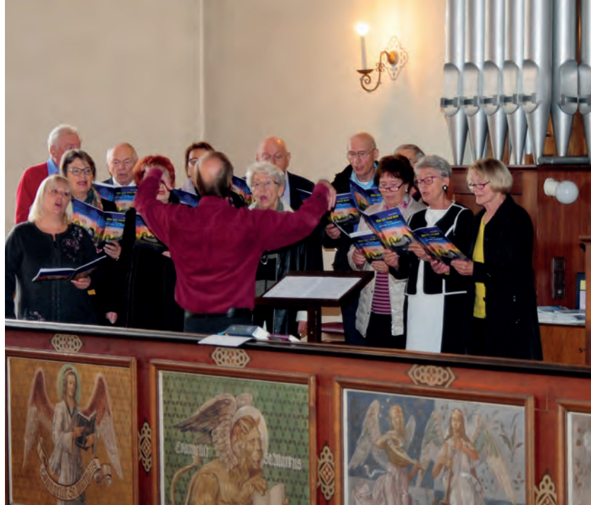
Unser Kirchenchor im Jubiläumseinsatz